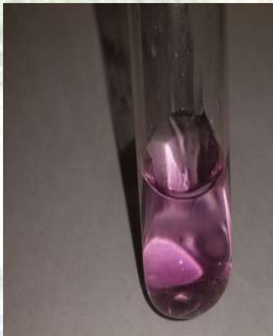
Результат 1 пробы.