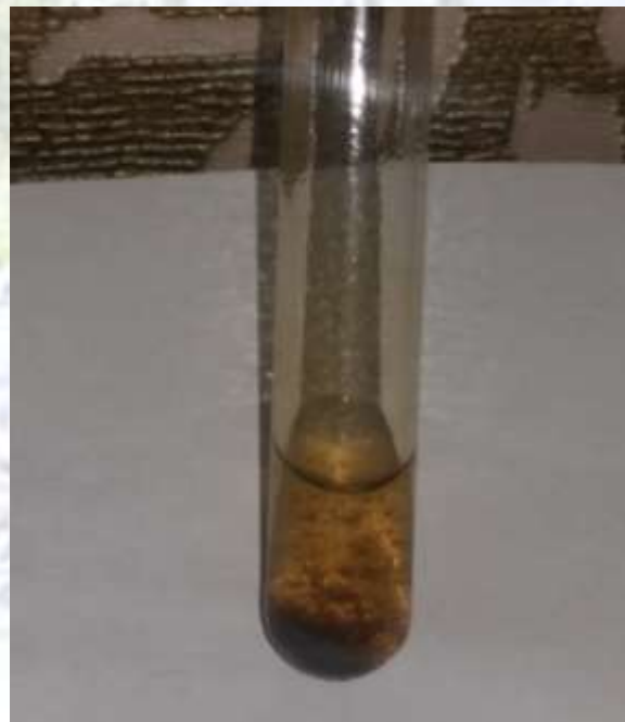
Результат 2 пробы.