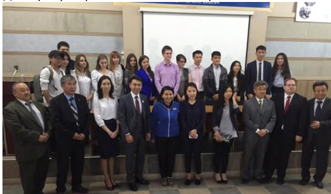
Эл аралык конференциянын катышуучулары «Логистика - өнүгүү вектору».