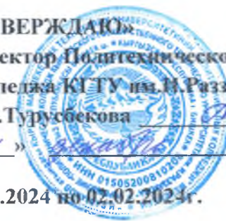
График экзаменационной сессии на осенний семестр за 2023-2024 учебный год с 22.01.2024 по 02.02.2024 г. гр. ЭССС11-1-22