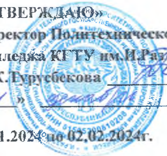
График экзаменационной сессии на осенний семестр за 2023-2024 учебный год с 22.01.2024 по 02.02.2024г. гр. ОПУТ11-1-22