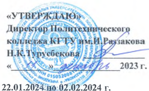
График экзаменационной сессии на осенний семестр за 2023-2024 учебный год с 22.01.2024 по 02.02.2024 г. гр. TOP9-2-21

Примечание: 1. Итоговый контроль в Online режиме только для студентов по индивидуальному графику. 2. Болеющих студентов отметить в I ведомости.