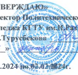
График экзаменационной сессии на осенний семестр за 2023-2024 учебный год с 22.01.2024 по 02.02.2024 г. гр. ТОСВТ9-1-21