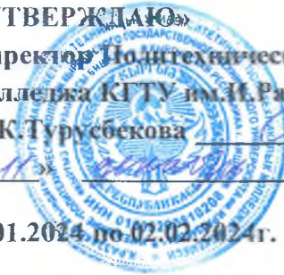
График экзаменационной сессии на осенний семестр за 2023-2024 учебный год с 22.01.2024 по 02.02.2024 г. гр. ЭС9-2-21