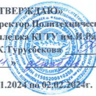
График экзаменационной сессии на осенний семестр за 2023-2024 учебный год с 22.01.2024 по 02.02.2024г. гр. ЭССС9-1-21