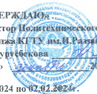
График экзаменационной сессии на осенний семестр за 2023-2024 учебный год с 22.01.2024 по 02.02.2024 г. гр. ОПУТ9-1-21