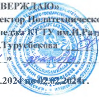
График экзаменационной сессии на осенний семестр за 2023-2024 учебный год с 22.01.2024 по 22.02.2024 г. гр. ЭС9-1-21