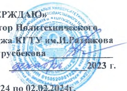
График экзаменационной сессии на осенний семестр за 2023-2024 учебный год с 22.01.2024 по 02.02.2024г. гр. ЗЧС9-1-21