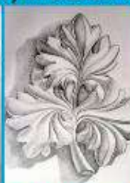
ОБРАЗЦЫ ПО РИСУНКУ