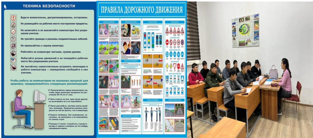
Ѳрт коопсуздукту, жолдо жүрүү эрежелери, техникалык коопсуздук жѳнүндѳ маалымат берүү (Сентябрь)