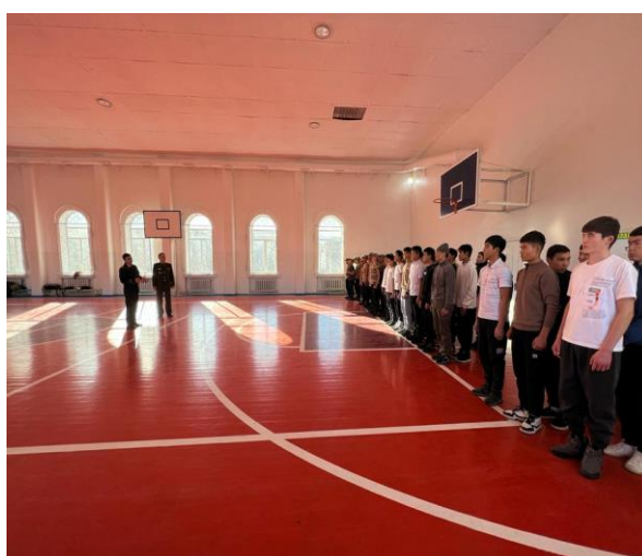
1-курстар арасында аскерге чейинки даярдык сабагында өтүлгөн жарыш