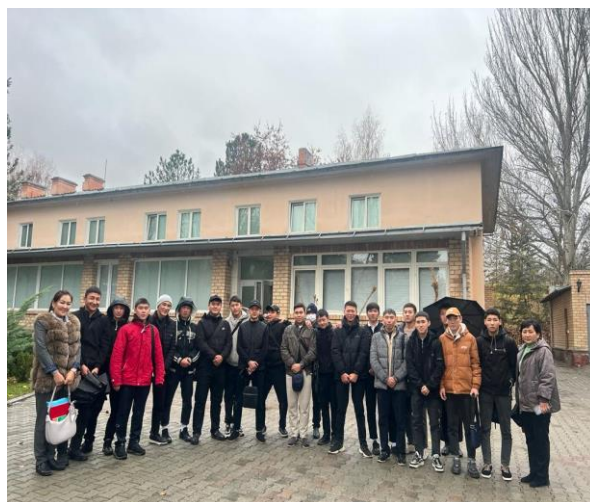
Ч.Айтматовдун 95 жылдыгына карата иш-чара: Айтматов ааламына саякат (Ноябрь)