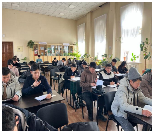
Колледжтин китепканасы менен тааныштыруу (Сентябрь)