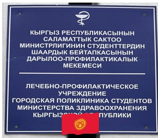
Медициналык кароодон өтүү (Октябрь), Тамекинин зыяндуулугу (Октябрь)