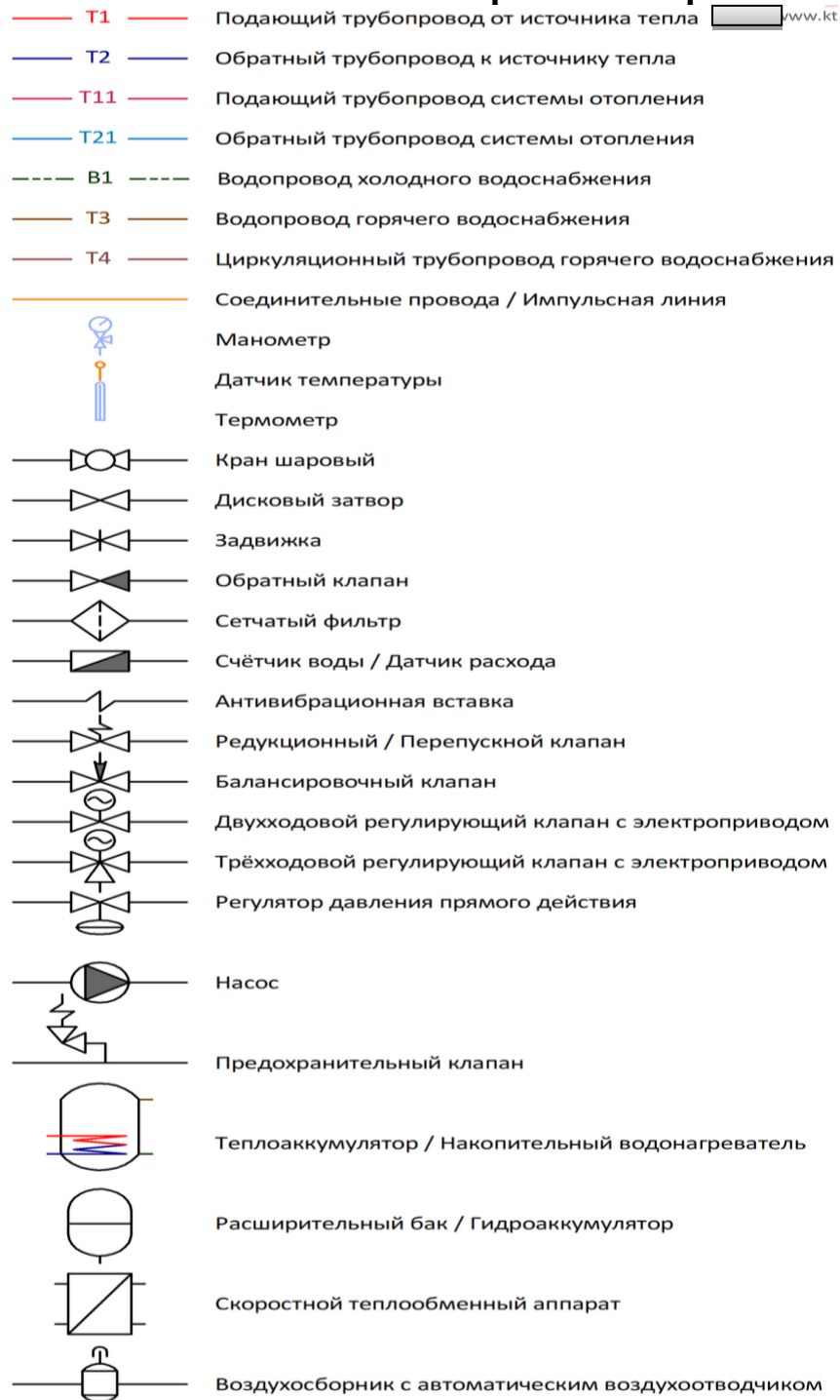
Таблица 3- Условные обозначения на чертежах генерального плана