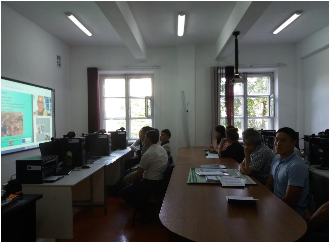
«Изменение климата и деградация Земли». Преподаватели и студенты кафедры «Охрана окружающей среды и рациональное использование природных ресурсов». Сентябрь, 2017.