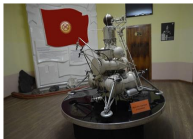
Луна-24 с буровой установкой

Поступив в колледж, бывший школьник окажется не только в новом учебном заведении, в новом коллективе, но и познакомится с новой системой современного обучения. За короткий промежуток учебы в колледже можно определиться, насколько верно выбрана специальность, и уже осознанно идти к цели с выбором дальнейшей трудовой деятельности, а также вуза, для продолжения учебы.