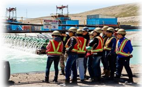
Студенты на практике

Горно-технологический колледж КГУ им. академика У. Асаналиева – это динамично развивающееся учебное заведение, имеющее все необходимые условия для подготовки квалифицированных специалистов среднего звена по 8 специальностям очной формы обучения: